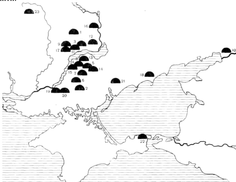
Рис.1. Карта розташування скіфських царських курганів: