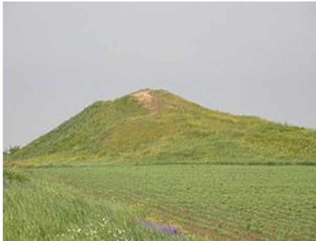
Рис. 2. Сучасний вигляд кургану Огуз

Тут вони помітили, що в обвалі стінки відкрилася незаймана могила. Судячи по знахідках, тут була похована шляхетна скіф'янка.