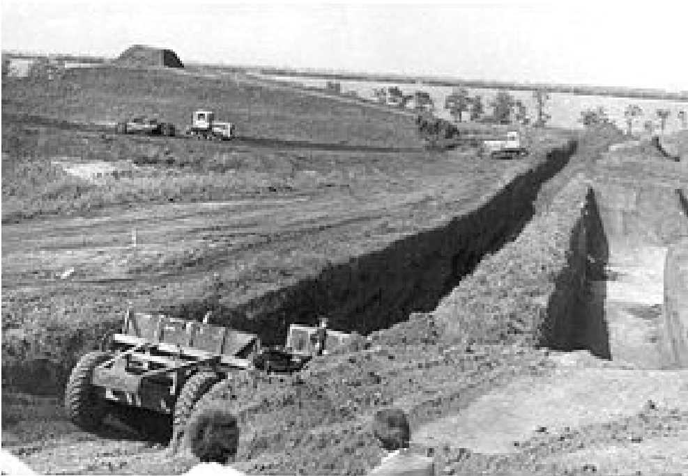
Рис. 3. Розкопки кургану експедицією під керівництвом Ю. В. Болтрика

Північна могила також виявилася пограбованою, але в ґрунті заповнення вхідної ями та підземної поховальної камери вдалося зібрати чимало решток поховального інвентарю [8 - 13].