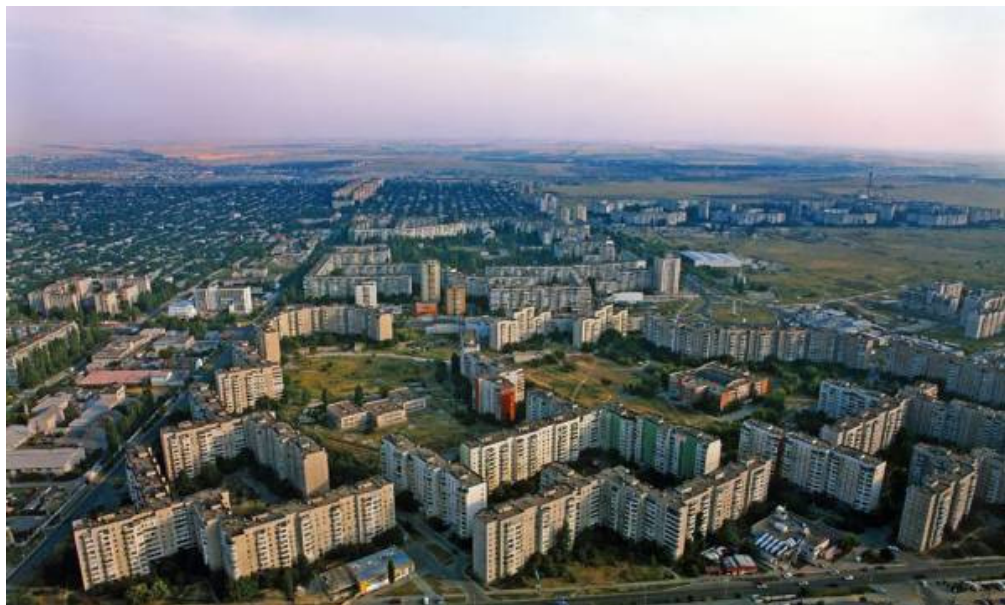
Рис. 8 Проспект імені адмірала Сенявіна у Херсоні.

Але повернемося до Херсона. Ось який вигляд має сучасний проспект імені адмірала Сенявіна, що знаходиться у Таврійському мікрорайоні міста (рис. 8, 9).