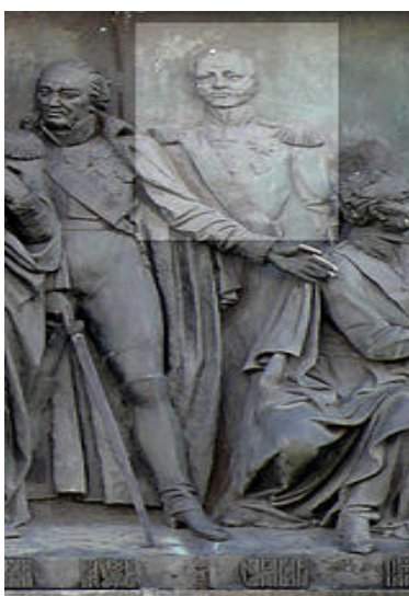
Рис. 6 Д. М. Сенявін на пам'ятнику «1000-летие России» у місті Великий Новгород