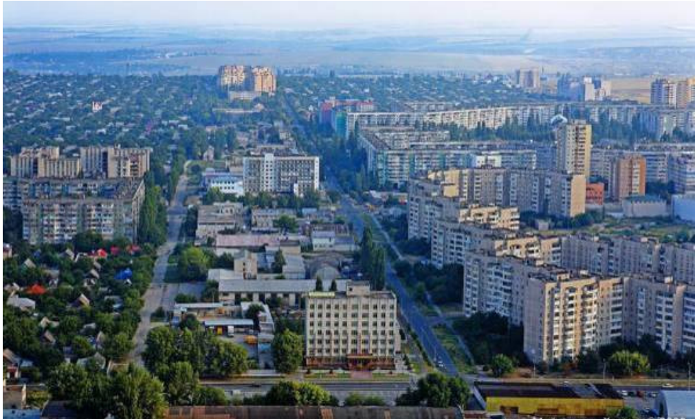
Рис. 9 Проспект імені адмірала Сенявіна у Херсоні