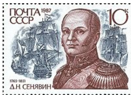
Рис. 5 Поштова марка СРСР, 1987 рік.