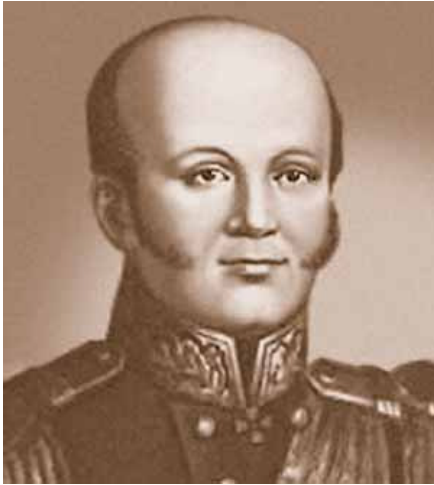
Рис.2 Д.М. Сенявін

1 травня 1780 року випускник корпусу мічман Сенявін на кораблі «Князь Володимир» вирушив з ескадрою до Атлантики для охорони судноплавства; за результатами дворічного плавання командування відмітило його «зразкове прагнення до служби» (рис.2). Після повернення додому у 1782 році офіцера, що подавав надії, призначили на середземноморську ескадру, але перед виходом разом з п'ятнадцятьма іншими мічманами відкомандирували на Азовську флотилію.