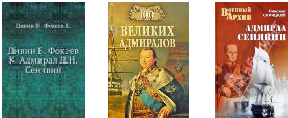
Рис. 7 Публікації, присвячені адміралу Д.М.Сенявіну

Але повернемося до Херсона. Ось який вигляд має сучасний проспект імені адмірала Сенявіна, що знаходиться у Таврійському мікрорайоні міста (рис. 8, 9).