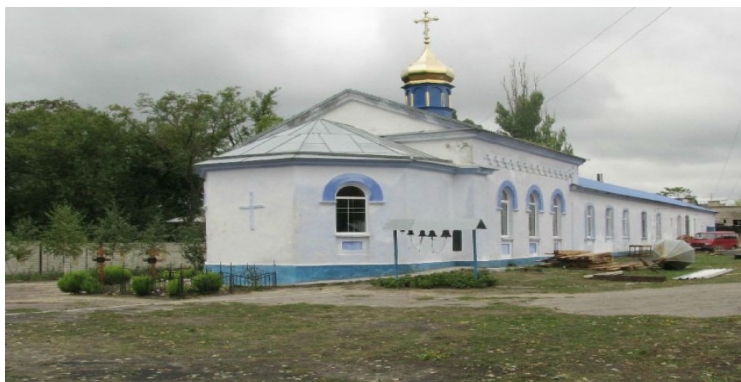
Рис 1. Михайловская церковь