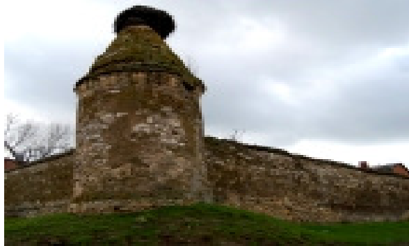
Рис 4. Северо-восточная башня

мостиком, которая пересекает речку. Если у Вас есть время - можно прогуляться по этой дороге, ведущей через мостик вниз - к Днепру и озерам [2].