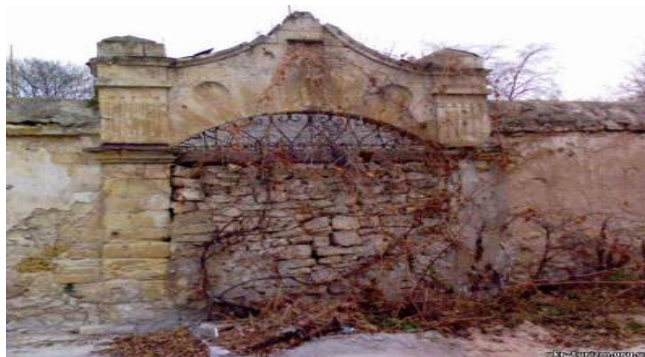
Рис 3. Западные ворота монастыря

Також взле монастиря протекає маленька симпатична речушка Каменка - приток Дніпра. В сухе время года она доволно узкая, а весной, в паводок, может разливаться настолько, что сухой остается только дорога с