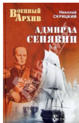
Рис. 7. Публікації, присвячені адміралу Д.М. Сенявіну