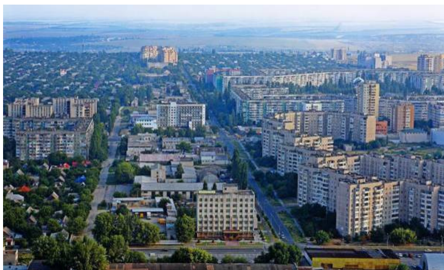
Рис. 9 Проспект імені адмірала Сенявіна у Херсоні