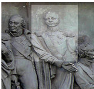
Рис. 6. Д.М. Сенявін на пам'ятнику «1000-летие России» у місті Великий Новгород