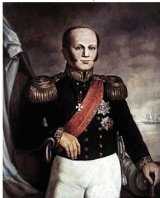
Рис.3. Д.М. Сенявін у чині контр-адмірала

У березні 1790 року Д. М. Сенявіна призначили командиром корабля «Навархія Вознесіння Господнє»; у битві при Каліакрії він, на думку Ф.Ф. Ушакова, «виявив хоробрість і мужність».