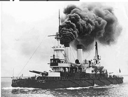
Рис. 4. Броненосець берегової оборони російського флоту «Адмірал Сенявін»

- Архіпелаг « Острова Сенявіна » у східній частині Каролінських островів у Тихому океані .