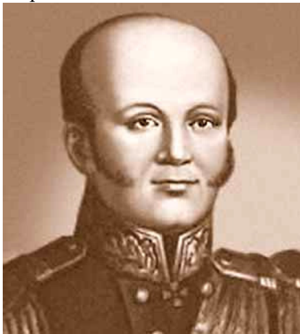
Рис.2. Д.М. Сенявін

Дмитро Сенявін народився 6 серпня 1763 року в селі Комлево Боровського повіту Калузької губернії. У лютому 1773 року десятирічного хлопчика віддали за підтримки А.Н.Сенявіна до Морського кадетського корпусу. Перші три роки кадет мало приділяв уваги навчання, однак настанови дядька-флотоводця та старшого брата, вже офіцера, примусили підлітка братися за розум. У 1779 році Сенявін отримав чин гардемарина. Влітку наступного року він вперше брав участь у плаванні від Кронштадта до Ревеля і назад, у 1779 році в ескадрі контр-адмірала Хметевського на кораблі «Преслава» виходив на захист нейтрального судноплавства.