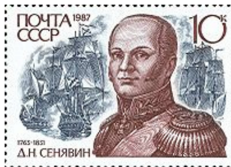
Рис. 5. Поштова марка СРСР, 1987 рік.