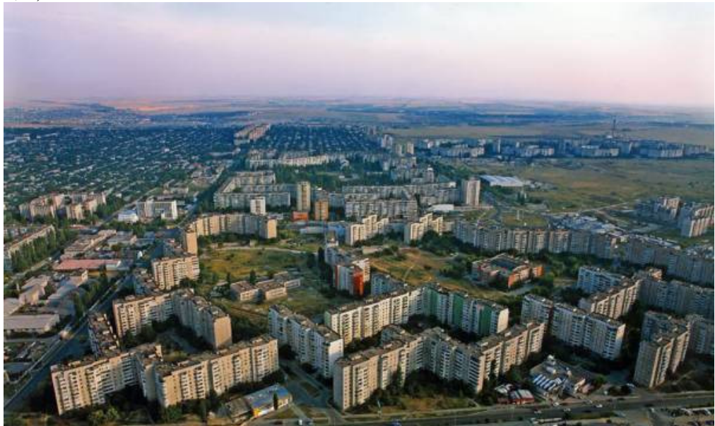
Рис. 8 Проспект імені адмірала Сенявіна у Херсоні.

Але повернемося до Херсона. Ось який вигляд має сучасний проспект імені адмірала Сенявіна, що знаходиться у Таврійському мікрорайоні міста (рис. 8, 9).