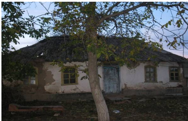
Рис. 4. Нежила торцева хата з чотирихилим дахом

Маленькі хатинки мали переважно двосхилий дах, у якому в'язанки очерету укладались на дерев'яний каркас. Великі будинки мали чотирихилий дах, також з очерету. Чотирихилий дах української хати – риса, притаманна народній архітектурі усієї України з певними регіональними відмінностями.