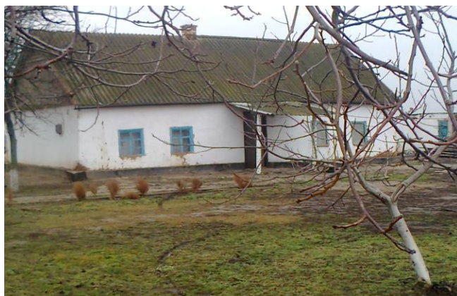
Рис. 1. Жила торчева хата

Основним будівельним матеріалом, який використовували жителі Келегейських хуторів, а пізніше і Гладківки, були глина, очерет, хмиз і солома. Досліджені залишки старих будівель вказують на широке викорис-