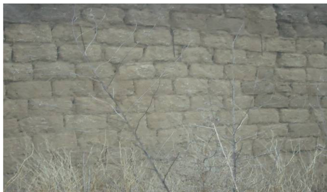
Рис. 6. Стіна з калибу

Крім каркасних будівель у Гладківці представлено будівлі з калибу. Головний будівельний матеріал – калиб/саман заготовляли до початку будівельних робіт. Замість для саману складався з глини і соломи. Для якісного виготовлення замісу використовували коня, якого водили по колу поступово підсипаючи у вологу глину солому. За допомогою спеціальних прямокутних дерев'яних форм виготовляли цеглу-сирець, яку висушували на сонці. Коли було завершено виготовлення калибу (для будинку його потрібно до 1000 штук), розпочинали будівництво. Будівництво хати з калибу відбувалось набагато швидше, ніж будівництво «торчової» хати. Та і якість такої будівлі була вищою. Єдиним недоліком хати з калибу було її незахищеність перед опадами. Рясні весняні та осінні дощі могли надмірно зволожити стіни. Тому у кінці 60 років глинобитні будинки почали обкладати силікатною цеглою.