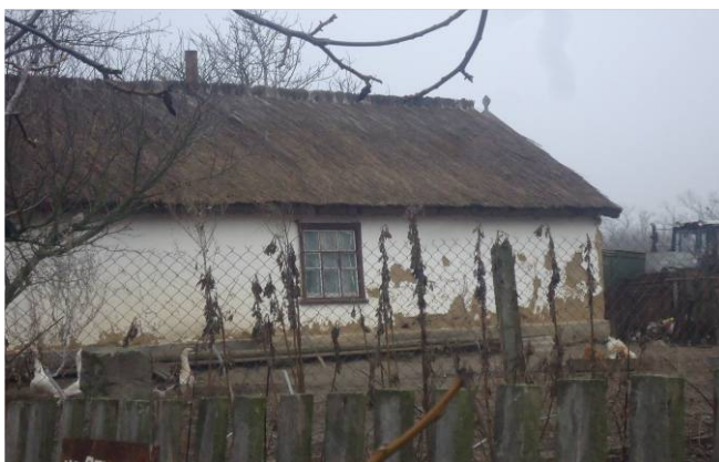
Рис. 5. Залишки побілки на хаті з калибу

Після зведення стін і завершення даху господаря та її найближчі родичі або сусіди білили стіни. До 30-40 років ХХ століття для біління стін використовували білу глину, яку добували у нашій місцевості. Завдяки цьому будинки мали не тільки привабливий вигляд-поєднання білосніжних стін із золотавим кольором очерету, але й забезпечувалась майже ідеальна гігієна житла.