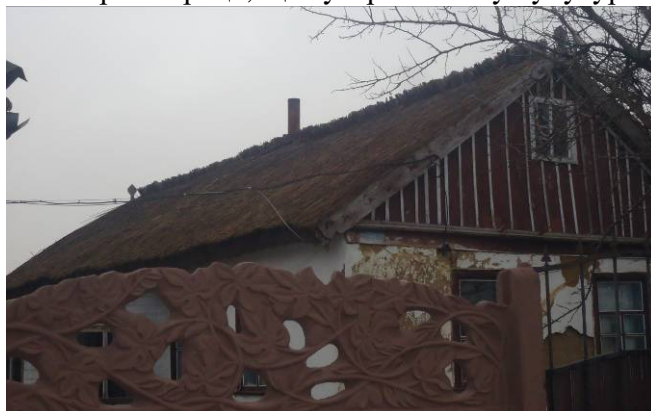
Рис. 3. Типова торцева хата з двосхилим дахом з очерету

У залежності від заможності господарів розміри хати були різними – від невеликих хатинок до просторих будинків. Матеріалом для даху слугував переважно очерет, який заготовляли у плавнях урочища Буркути або привозили з берегів озер і озерець, що зустрічались у кучугурах. [3]