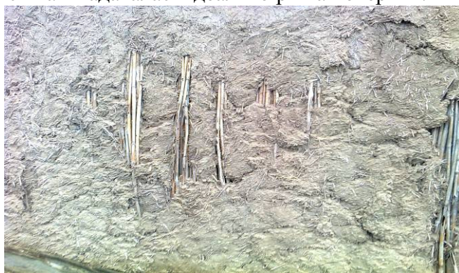
Рис. 2. Груба мазка хати

тання даних матеріалів. З колод і очерету зводився каркас майбутньої хати, який укріплювався з обох сторін вальками з глини. Укріплення вальків здійснювалось поступово, по мірі висихання нижніх шарів. Після зведення стін проводили «грубу» і «тонку» мазку, яку виконували жінки. При обмазуванні стін «грубою» мазкою широко використовували соломку, яка забезпечувала не тільки збереження форми, але й була добрим ізоляційним матеріалом, який зберігав тепло. Вікна старих будівель були невеликими, оскільки існувала потреба збереження тепла взимку і прохолоди у літні місяці. «Тонка» мазка або «шпаровка» здійснювалась після висихання «жаркі товстої» мазки. У ході «шпаровки» за допомогою дерев'яних знарядь – гладушок стінам надавалась ідеально рівна поверхня.