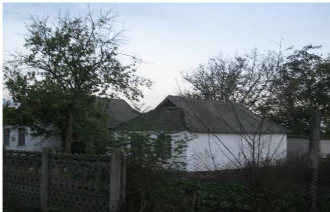
Рис. 7. Типовий будинок 60-80 років ХХ століття

Зберігається традиційна для Голопристанщини 3-4 камерне житло з чотирихилим дахом. Форма даху повністю повторює дах з очерету, хоча для покриття будівель широко використовується шифер. Унікальною особливістю будівель прибережної Голопристанщини є прикрашення даху зображенням двох голубів, голівки яких зорієнтовані у протилежні сторони. До голубків схилами даху підбираються або лисиці, або стилізовані змії. Фігурки голубків утворюють тризуб, який мав би бути оберегом житла, прикликати в оселю добро, мир, злагоду. Зображення змії за слов'янською міфологією є не тільки символом води, але і знаком Велеса – бога-покровителя скотарства і торгівлі. У окремих випадках спостерігались зображення коней, відомий символ достатку у Західній Європі та виводку каченят. Інтерпретація цього символу потребує додаткових досліджень. У певних випадках стилізація фігурок голубків замінюється звичайним ромбом або пікою.