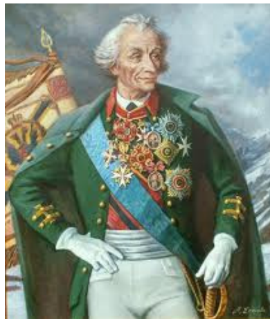
Рис.3. Полководець О.В. Суворов

О.В. Суворов. 1787 р. до Херсона приїхав О.В. Суворов. Під його командуванням війська Херсонського корпусу повинні були обороняти Херсонсько-Кінбурнський район. О.В. Суворов оглянув район майбутніх військових дій, у тому числі Херсонську фортецю, підступи до міста та вжив заходи щодо їх укріплення. Досвідчений полководець та стратег Суворов підготував фортецю до оборонних дій і отримав перемогу над турками у битві під Кінбурном, за що був нагороджений орденом Андрія Первозванного. Після війни, в 1792 р. О.В.Суворов був призначений начальником військ Катеринославського намісництва. Свою штаб-квартиру він розмістив у Херсоні та продовжував удосконалення укріплень цього стратегічного району. Наприкінці 1794 р. Суворов був переведений в інший район Російської імперії.