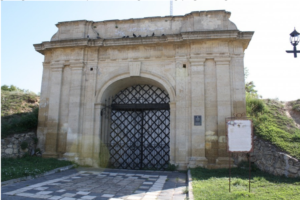
Рис. 6. Московські ворота

Потрапити до фортеці можна було через двоє воріт – Очаківські та Московські, які залишились до нашого часу. За виглядом та величавими розмірами вони нагадують давньоримські тріумфальні арки.