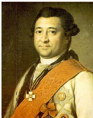
Рис.2. Один із засновників і будівників Херсона генерал І.А. Ганнібал

І.А. Ганнібал. 25 липня 1778 р. головним будівничим «новозаводимого на Дніпре при урочище Александровском Шанце города Херсона с надлежащими укреплениями, и в оном верфи и адмиралтейства» був призначений генерал-цейхмейстер І.А.Ганнібал. Через декілька місяців він повідомляв, що 19 жовтня закладено фортецю і місто, а також два корабельні еллінга.