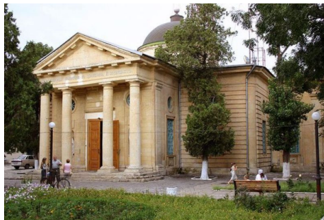
Рис.8. Катерининський собор

На Перекопській є будинок №18, на якому розміщені дві меморіальні дошки.