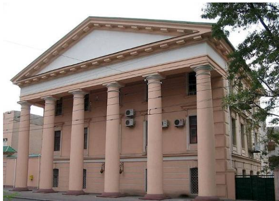
Рис. 7. Херсонський арсенал

Далі за маршрутом - Дім офіцерів та стадіони «Спартак» і «Кристал». Навпроти останнього знаходиться будівля кіноконцертного залу «Ювілейний».