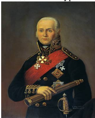
Рис.4. Адмірал Ф.Ф. Ушаков

На вулиці міста, названій іменем великого полководця, зберігся будинок початку 80-х років XVIII ст. (№ 1а), в якому Суворов мешкав у 1792-1794 рр. На ній же встановлено пам'ятний бюст полководця, біля якого завжди багато туристів.