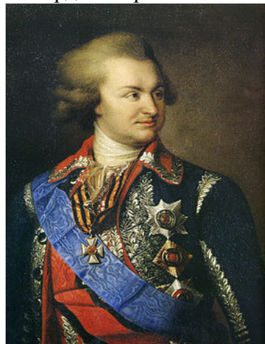
Рис.1. Засновник міста Херсона – Г.О. Потьомкін.

18 червня 1778 р. Катерина II видала наказ Новоросійському генерал-губернатору Г.О.Потьомкіну (російський державний і військовий діяч, дипломат, генерал-фельдмаршал (з 1784), в якому наказувала знайти в гирлі Дніпра місце для будівництва гавані й верфі та найменувати це місце Херсоном. Так було засновано місто, назване іменем давньогрецької колонії Херсонес (в середні віки - Херсон), яке відіграло у свій час значну роль в історичному розвитку Північного Причорномор'я: «Место сие повеливаем назвать Херсоном».