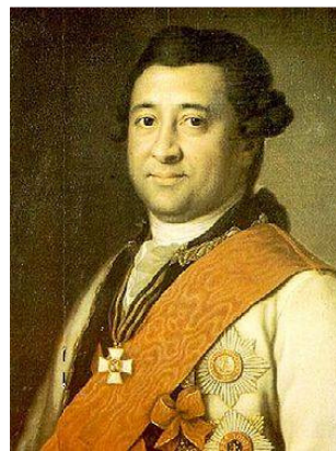
Рис. 1 Портрет Івана Ганнібала роботи невідомого художника

вернув до Херсона та навколишніх земель багато грецьких та італійських вихідців.