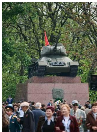
Рис.8 Парк Слави

Парк Слави (рис. 8) знаходиться у центрі міста і фактично є меморіальним комплексом, збудованим на честь героїв, які захищали місто.