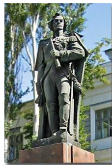
Рис.6 Пам'ятник Ф.Ф. Ушакову

Проспект Ушакова — центральний проспект Херсона, розташований у Суворовському районі. З'єднує берег Дніпра із залізничним вокзалом. Стара його назва — вулиця Поштова. У XVIII столітті західна її частина нараховувала декілька кварталів — на той час вона була крайньою східною вулицею Грецького передмістя. На плані початку 50-х років XIX ст. мала назву Пестелевської, на честь херсонського губернатора Пестеля В. І., який обіймав цю посаду з 1839 по 1845 роки. За часи Пестеля було здійснено проект благоустрою набережної Дніпра, що і стало приводом для увічнення його ім'я на мапі міста — у назві вулиці, що саме і йшла від набережної. На плані 1855 року вулиця названа Поштовою, тоді як найменування "Пестелевський" перейшло до бульвару, який було засаджено при Пестелі В.І. на початку 1840-х років. У 1890 році Поштову вулицю перейменовано у Говардівську — на честь англійського лікаря, філантропа Джона Говарда, який помер від висипного тифу у Херсоні в 1790 році. З 1947 року — проспект носить ім'я російського флотоводця Федора Федоровича Ушакова (1745- 1817) — російського флотоводця, адмірала, святого Російської Православної Церк-