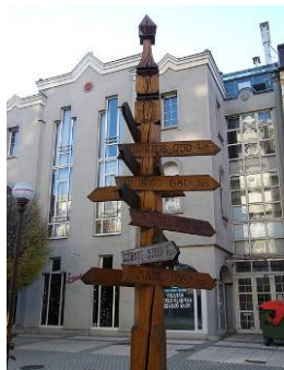
Рис.13 центр міста Залаегерсег

Вулиці, названі на честь міст-побратимів. Місто Херсон є членом Міжнародної Ассамблеї столиць і великих міст (суспільне некомерційне об'єднання, створене 2 вересня 1998 року для організації спільних дій з метою соціально-економічного розвитку міст.)