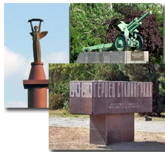
Рис. 7 Пам'ятники на лошак міста, присвячені подіям Другої світової війни

Існує велика кількість вулиць міста, які нагадують нам про героїв, які захищали Херсон під час війни. Серед них вулиці 28-ї армії, 49-ї Гвардійської Херсонської дивізії, 295-ої стрілецької дивізії, І. Куліка, Комкова, Покришена, Суботи, Шенгелія, Качалова і т.д. Розглянемо походження назви вулиці 49-ї Гвардійської Херсонської дивізії . Вулиця знаходиться у Дніправському районі. Названа на честь 49-ї гвардійської стрілецької дивізії, яка форсувавши річку Молочну перенесла наступальні дії на Херсонщину. Були звільнені: Нижні Сірогози, Нова Маячка, Козачі Лагері, Великі Копані, Раденськ, Костогризове та інші населені пункти. У ході Березнегувато-Снігурівської наступальної операції, 13 березня 1944 року, форсувала річку Дніпро, перерізала шосейну дорогу Херсон - Берислав, залізницю Херсон - Миколаїв і дала можливість 295-й стрілецькій дивізії звільнити Херсон [3].