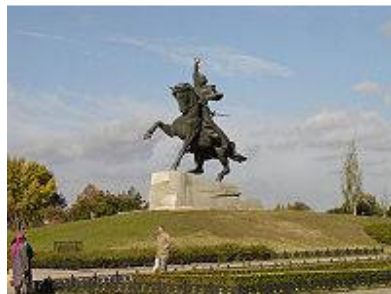
Рис.14 Пам'ятник О.В. Суворову у Тирасполі

З'являються нові видатні постаті, які роблять свій внесок у розвиток міста, і як наслідок – нові вулиці називають на їх честь. Тож топоніміка Херсона ще має багато матеріалу, який потребує дослідження.