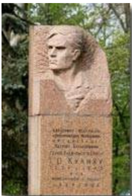
Рис. 10 Пам'ятник І. Кулику

Вулиця Ілюші Кулика (колишня назва: Козацька) — вулиця, розташована в Суворовському та Дніпровському районах Херсона. З'єднує проспект Ушакова з вулицею Залаегерсег.