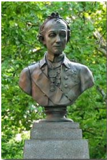
Рис. 5 Пам'ятник О.В. Суворову

У 1855 р. вулиця вже мала назву Суворовська. У 1927 р. Суворовську вулицю було перейменовано у вулицю 1-го Травня, а у травні 1941 вулиця отримала сучасну назву. Зараз вулиця починається з пам'ятника О.В. Суворову (рис.5).