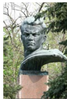
Рис. 12 Субота М.М.

Шенгелія Георгій Давидович, 1908 р.н., с. Кулаші, Грузія. Майор, командир батальйону 1038-го стрілецького полку 295-й Херсонської стрілецької дивізії 28-ї армії 3-го Українського фронту. Брав участь в оборонних боях на Україні, Північному Кавказі, у форсуванні Дніпра і визволенні міст Херсон, Миколаїв, Одеса, Ясько-Кишинівській та Вісло-Одерській операціях, форсуванні Одеру, штурмі Берліна. Помер 22 грудня 1981 року. Похований у Тбілісі.