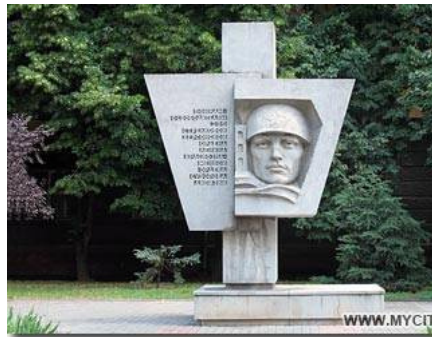
Рис. 9 Пам'ятник на честь героїв-визволителів 295-ї стрілецької дивізії

Але подальші історичні події визначили її теперішню назву. 20 грудня 1943 року 295-та стрілецька дивізія зайняла оборону на лівому березі Дніпра на рубежі: Олешки (місто Цюрупинськ), Гола Пристань, Стара Збур'ївка, Велика Кардашинка. 12 березня 1944 року група розвідників зайняла плацдарм на правому березі. 13 березня 1944 Херсон було повністю звільнено [3]. 13 березня 1983 року на честь героїв-визволителів на вулиці 295-ї стрілецької дивізії встановлено меморіал (рис. 9).